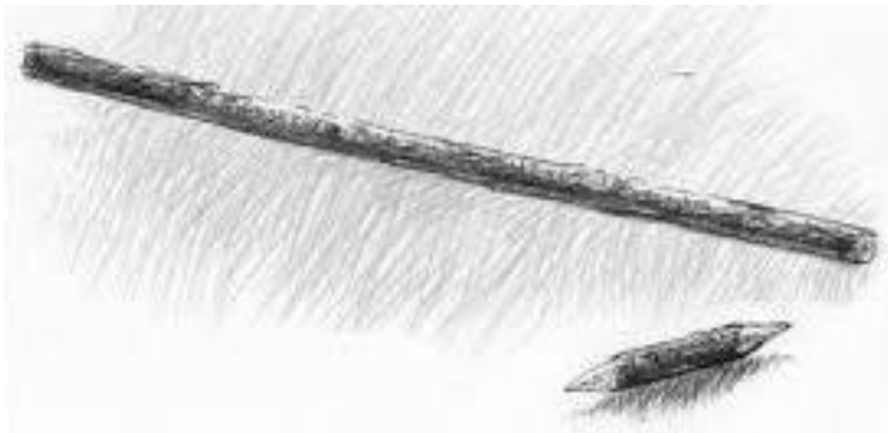
Piskor - piga